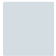
Pearl grey F4748-10001 Grigio perla