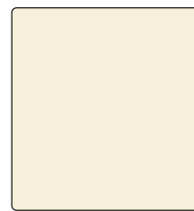
Ivory F4748-10081 Avorio